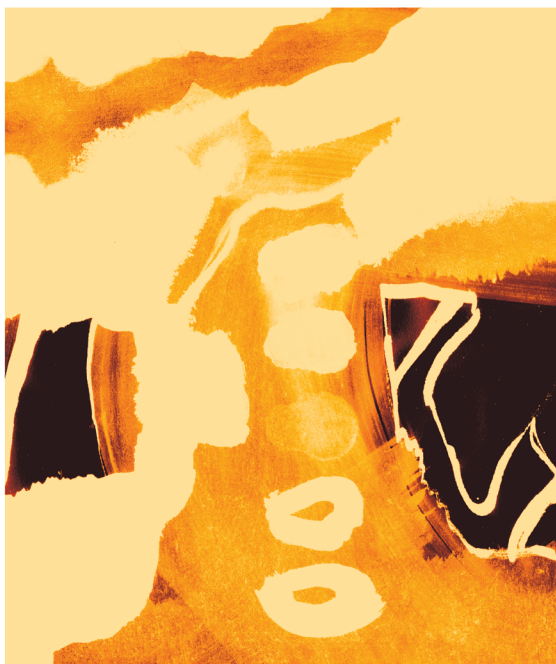
QUIET ISLAND telescope