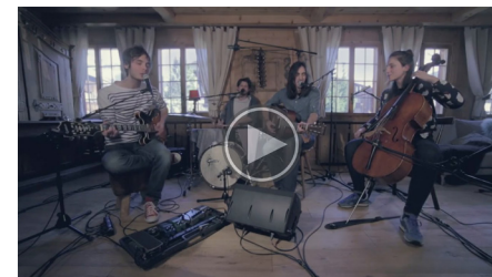
The Chalet Sessions - 2016